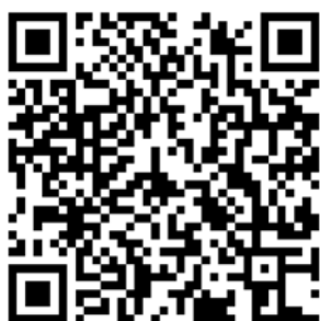
報名網址 QR Code

八、聯絡方式：大華科技大學教學發展中心王先生，電話 03-5927700 轉 2227